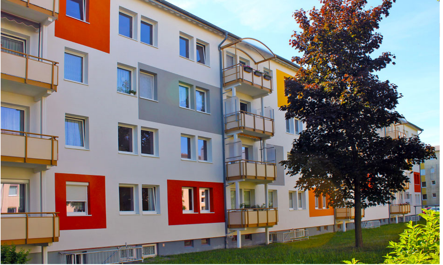
Die neugestaltete attraktive Fassade des Gebäudes Humboldtstraße 21–29.