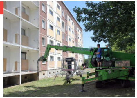
Rückbau der Balkone am Gebäude Prof.-Wagenfeld-Ring 30–33.

sem Jahr für den Wohnblock Humboldtstraße 21–29 ist bis auf einige wenige Restarbeiten bereits abgeschlossen.